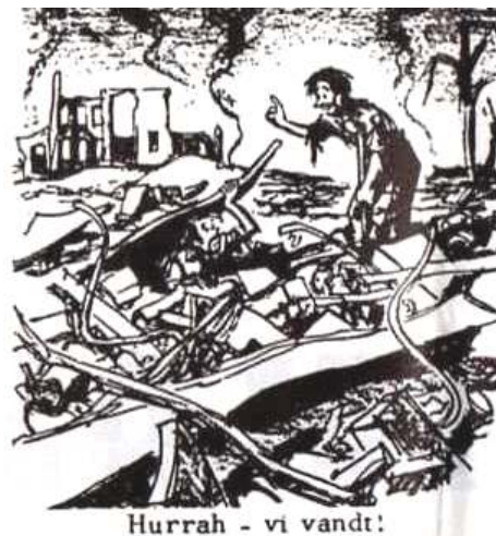
Hurrah - vi vandt!

You can no more win a war than you can win an earthquake." - Jeannette Rankin, first woman member in US Congress