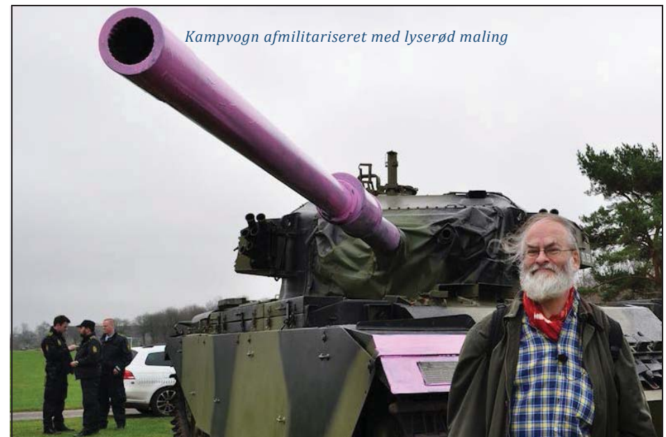
Kampvogn afmilitariseret med lyserød maling

PACIFISME ER EN LIVSHOLDNING ALDRIG MERE KRIG!