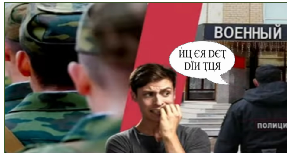
En video om at klare mødet med myndigheder

Ruslands manglende krigserklæring har givet de kontraktansatte soldater mulighed for frit at rejse hjem fra Ukraine. De russiske domstole har ikke kunnet beordre de hjemvendte soldater i krig, for der er jo ikke ”krig”. Desertørerne betegnes blot som refuseniks , og mister så deres militære arbejdsplads, men andet sker der ikke mod dem. Antallet af sådanne refuseniks er ikke officielt oplyst. Alt for få af soldaterne kender dog til denne gode mulighed, og gæve